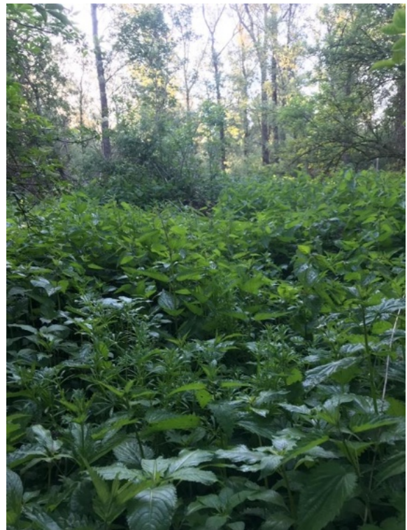
Na half mei worden de grienden zeer moeilijk begaanbaar want de grienden kennen geen paden.