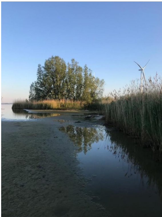
Rietkragen met goede populaties Kleine Karekieten. Op de achtergrond 1 van de 9 windmolens.